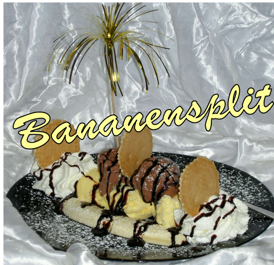
Vanilleeis, Schokoeis, Banane, Sahne, Schokocauce 3 Kugeln...€ 6,90 5 Kugeln...€ 7,90