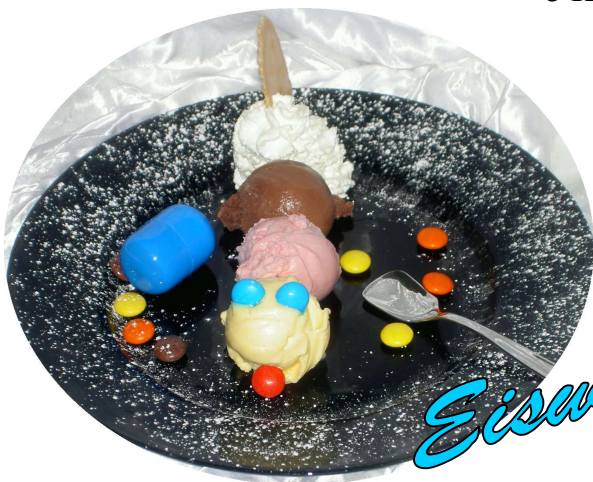
3 K. Eis, Sahne, Überraschung ...€ 4,80