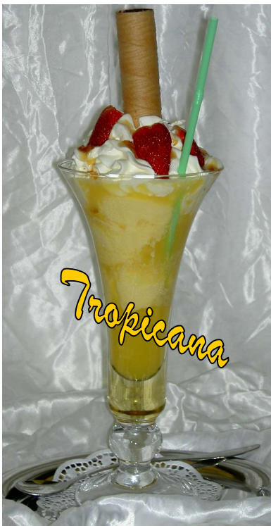
3 K. Vanilleeis, Orangensaft, Rum, Sahne € 6,90